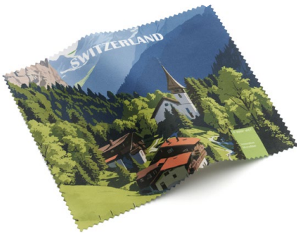
Ansicht des fertigen Brillentuchs